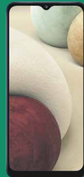
Samsung Galaxy A12 (1)

Luego de crédito de $170 garantizados a 24 plazos. Debe pagar el IVU