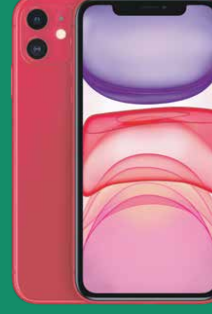
iPhone 11 64GB (1)

Luego de crédito de $400 garantizados a 30 plazos. Debe pagar el IVU