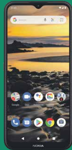
Nokia 1.4 (1)

Luego de crédito de $90 garantizados a 24 plazos. Debe pagar el IVU