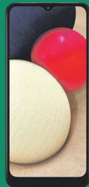
Samsung Galaxy A02 (1)

Luego de crédito de $90 garantizados a 24 plazos. Debe pagar el IVU