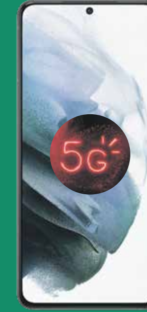
Samsung Galaxy S21 (1)

Luego de crédito de $410 garantizados a 30 plazos. Debe pagar el IVU