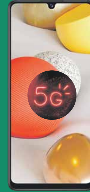
Samsung Galaxy A42 (1)

Luego de crédito de $310 garantizados a 24 plazos. Debe pagar el IVU