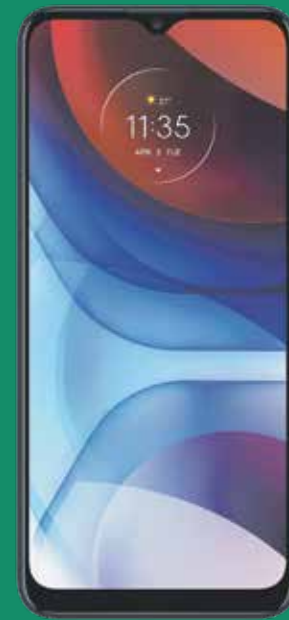
Motorola e7i Power (1)

Luego de crédito de $100 garantizados a 24 plazos. Debe pagar el IVU