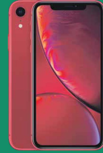
iPhone XR 64GB (1)

Luego de crédito de $800 garantizados a 30 plazos. Debe pagar el IVU