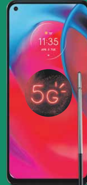
Moto G Stylus 5G (1)

Luego de crédito de $190 garantizados a 24 plazos. Debe pagar el IVU